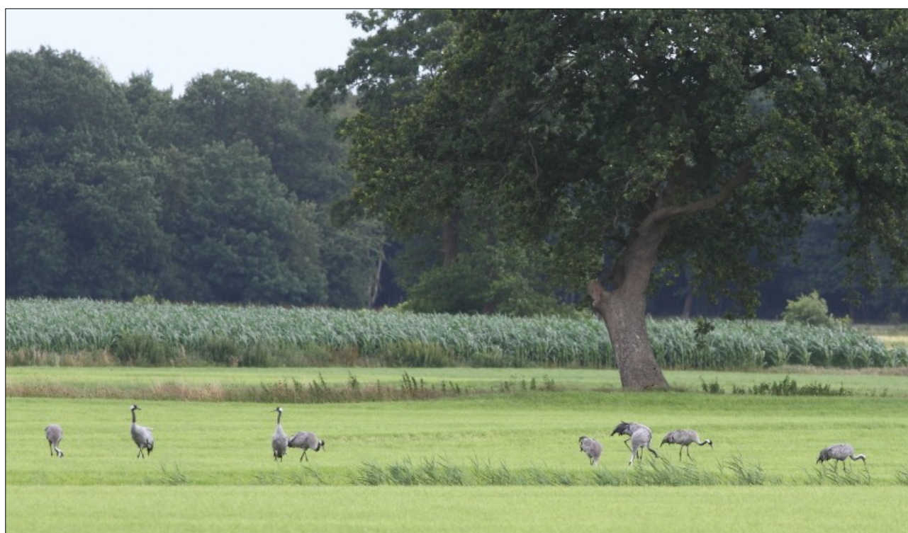
Groep pleisteraars in De Hoorns.